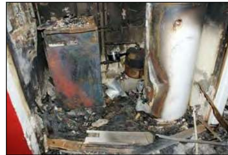
Ballon d'eau chaude