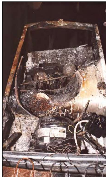
Surchauffe de la cloche d'un réfrigérateur