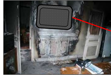
Téléviseur écran plat