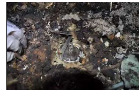
Spot très basse tension dans la ouate de cellulose.