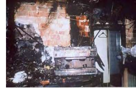
Machine à café